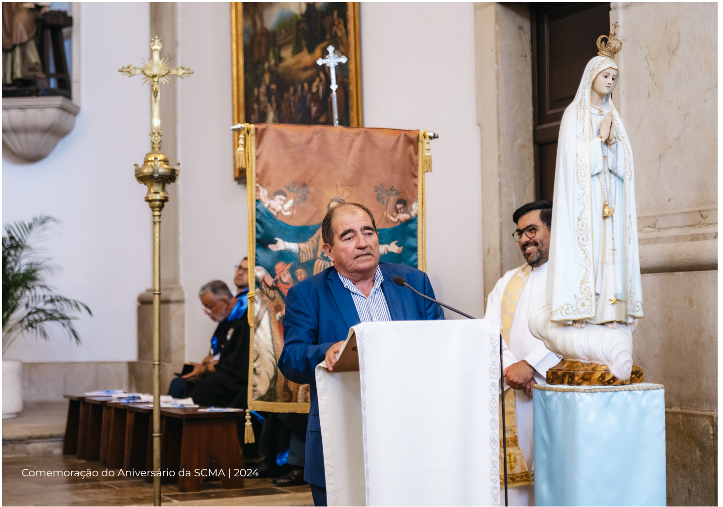
Comemoração do Aniversário da SCMA | 2024