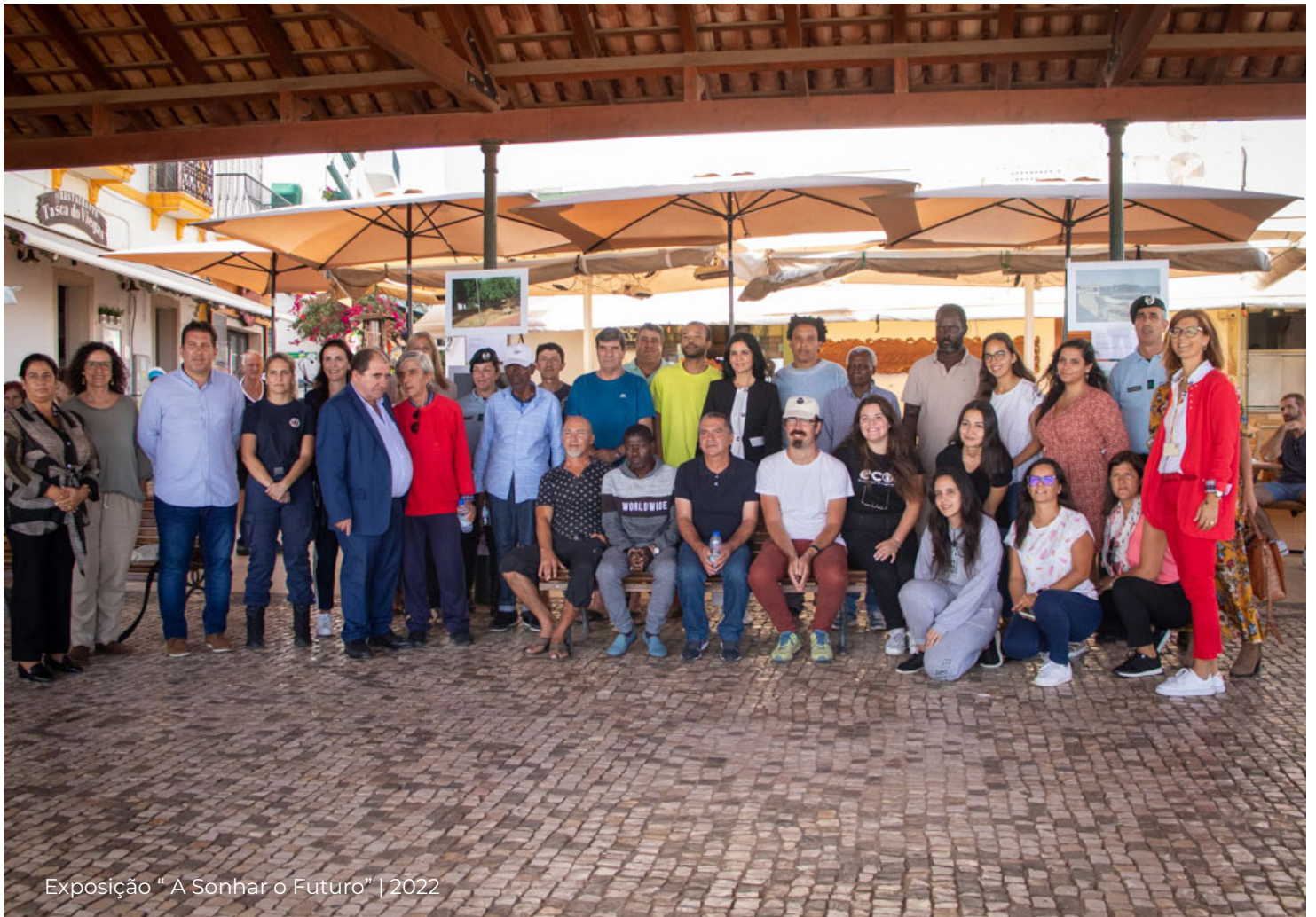
Exposição "A Sonhar o Futuro" | 2022