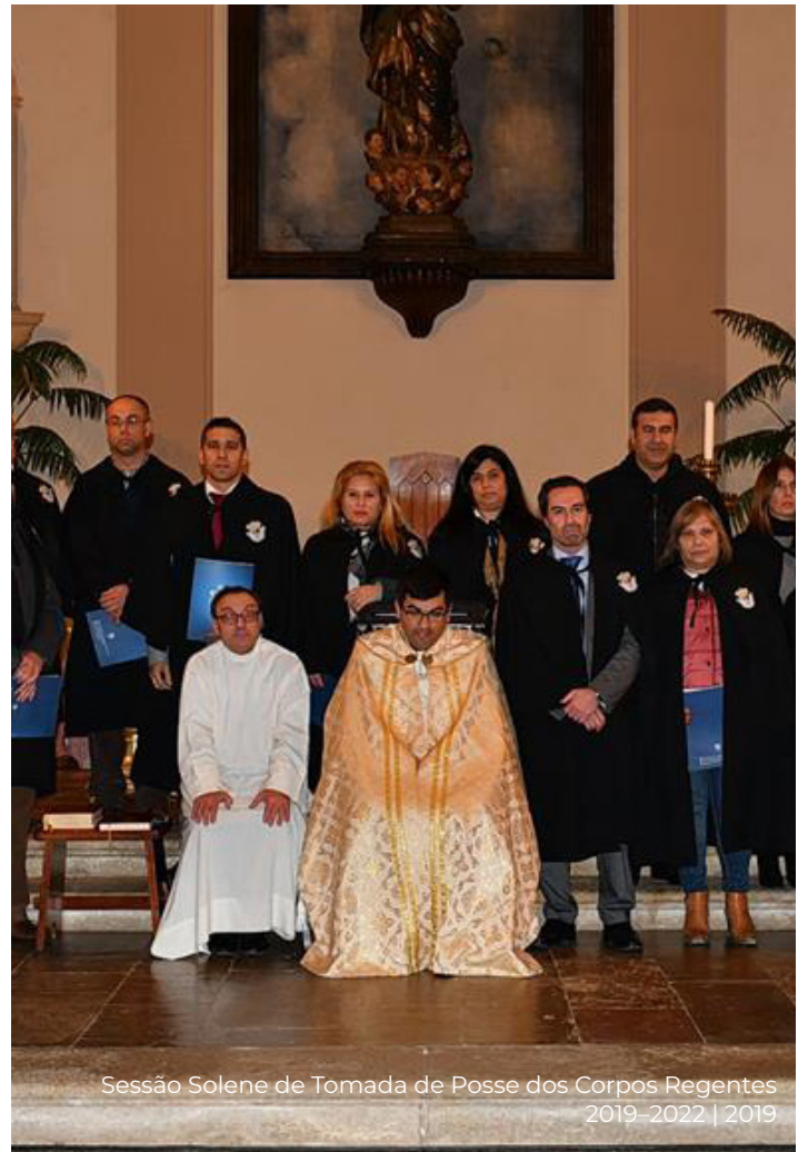
Sessão Solene de Tomada de Posse dos Corpos Regentes 2019-2022 | 2019