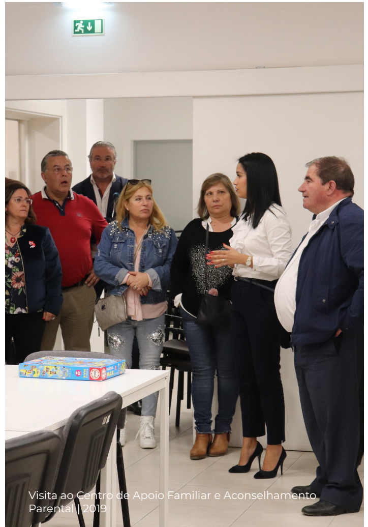
Visita ao Centro de Apoio Familiar e Aconselhamento Parental | 2019