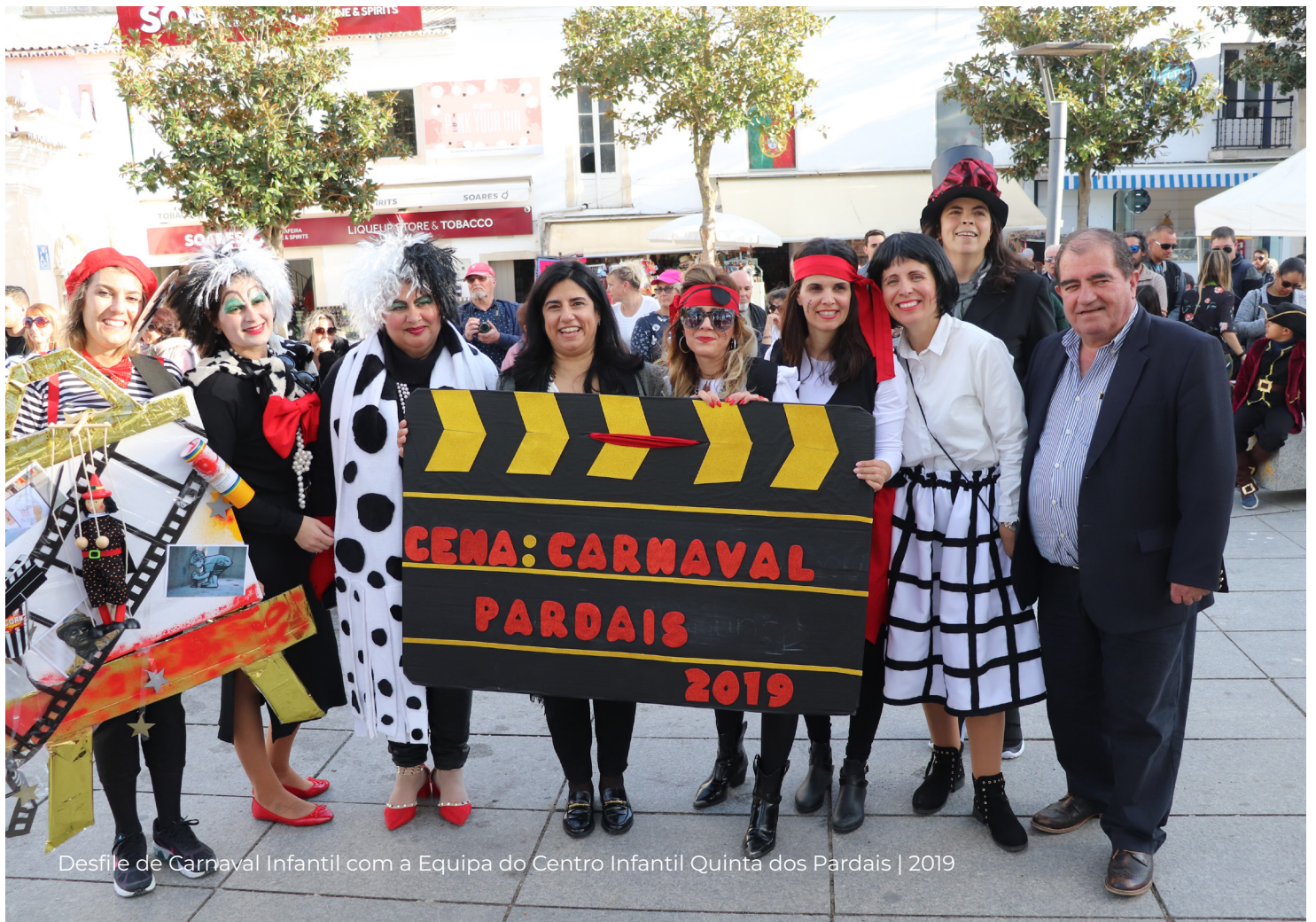
Desfile de Carnaval Infantil com a Equipa do Centro Infantil Quinta dos Pardais | 2019