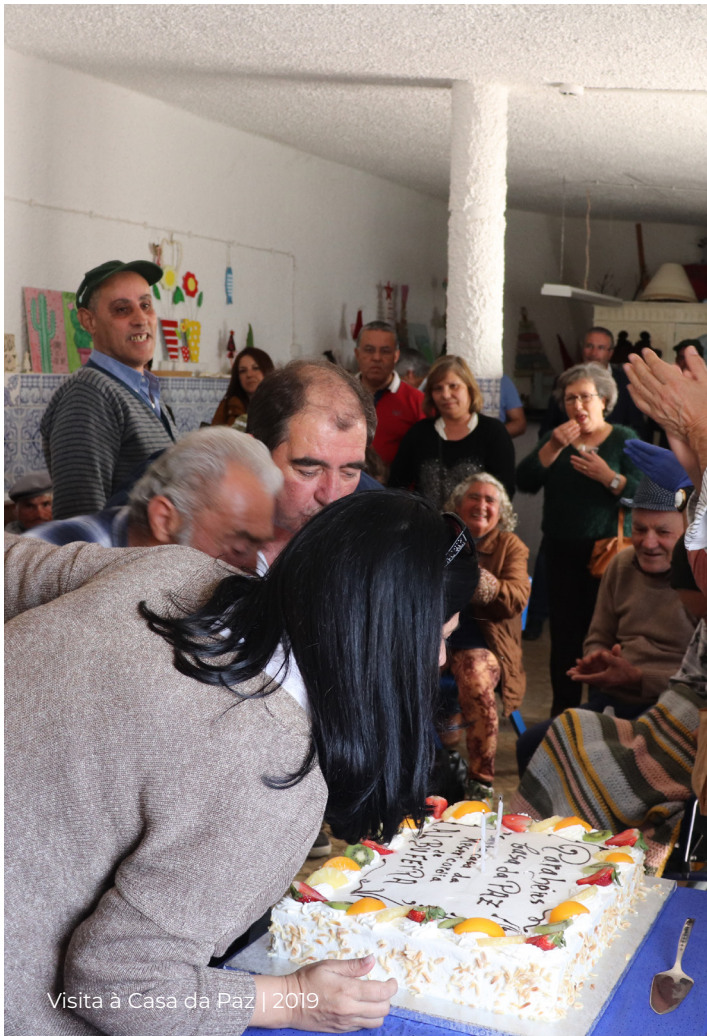
Visita à Casa da Paz | 2019