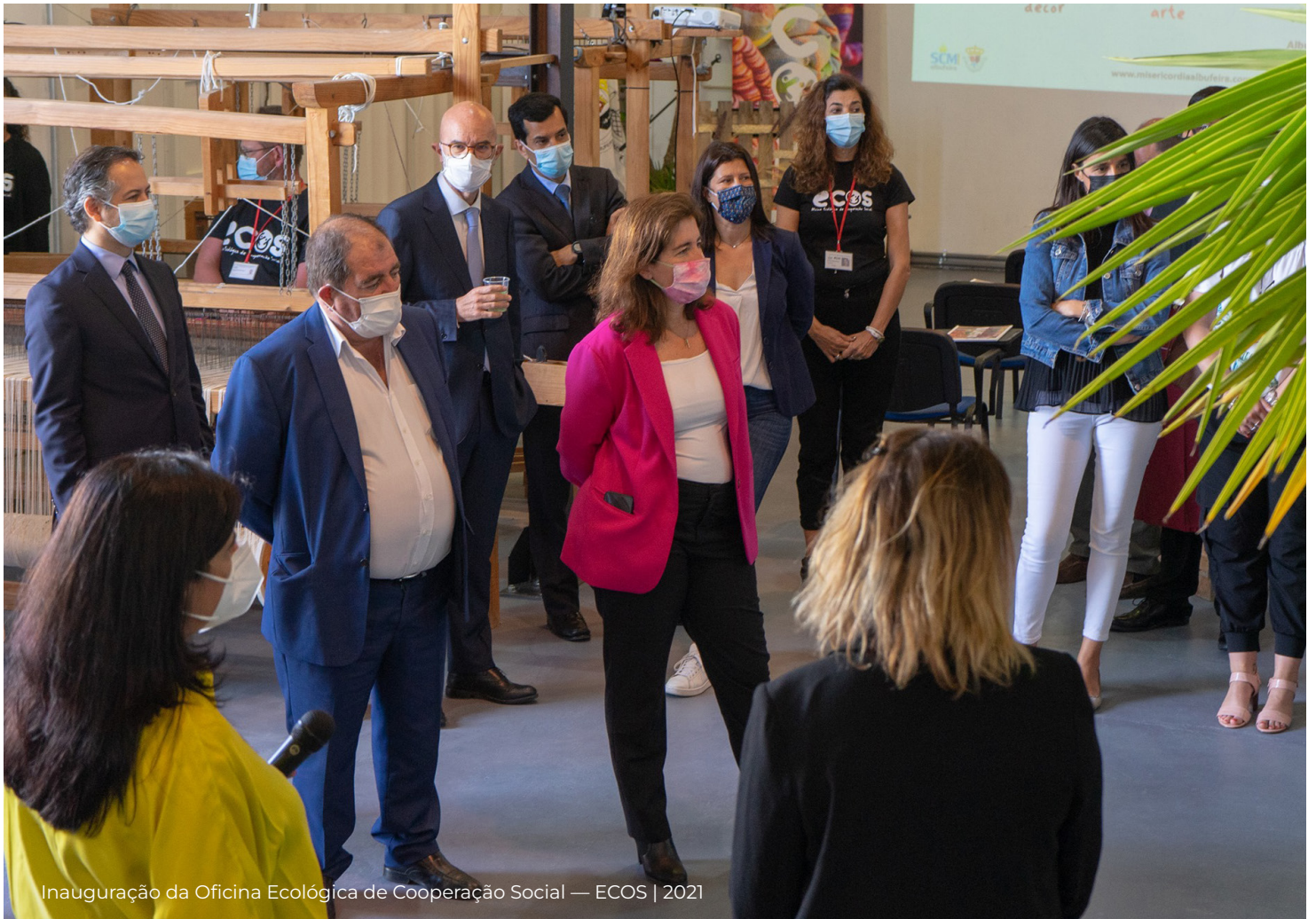
Inauguração da Oficina Ecológica de Cooperação Social — ECOS | 2021