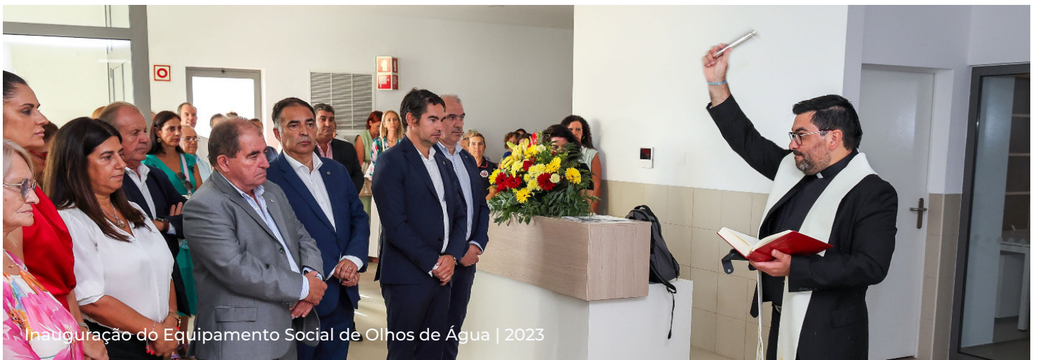
Inauguração do Equipamento Social de Olhos de Água | 2023