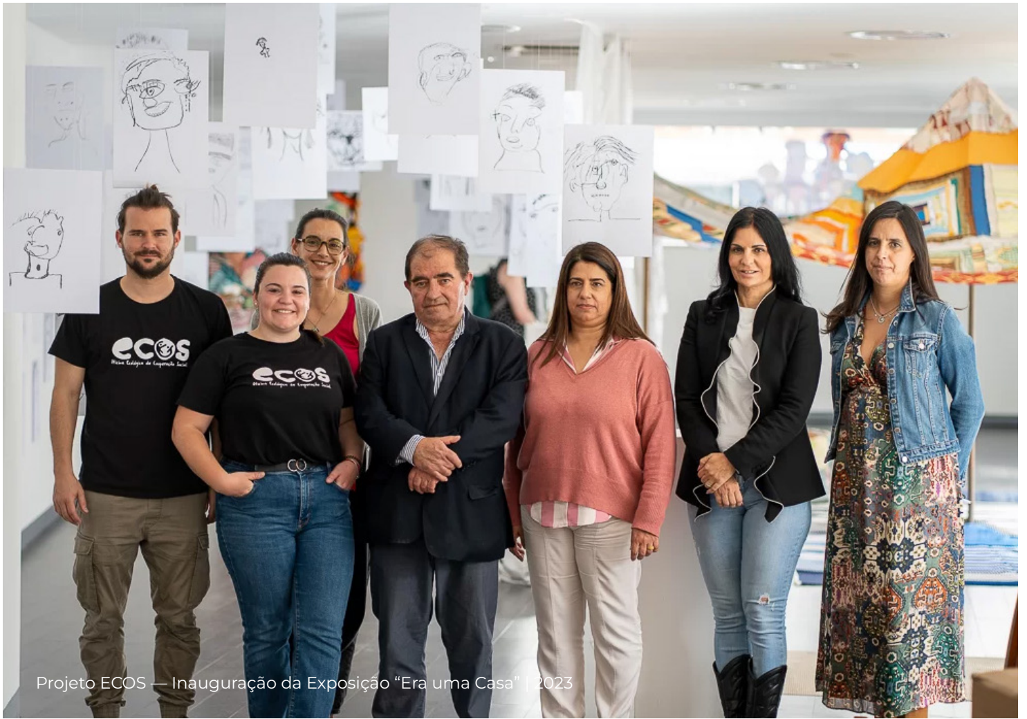
Projeto ECOS — Inauguração da Exposição “Era uma Casa” | 2023