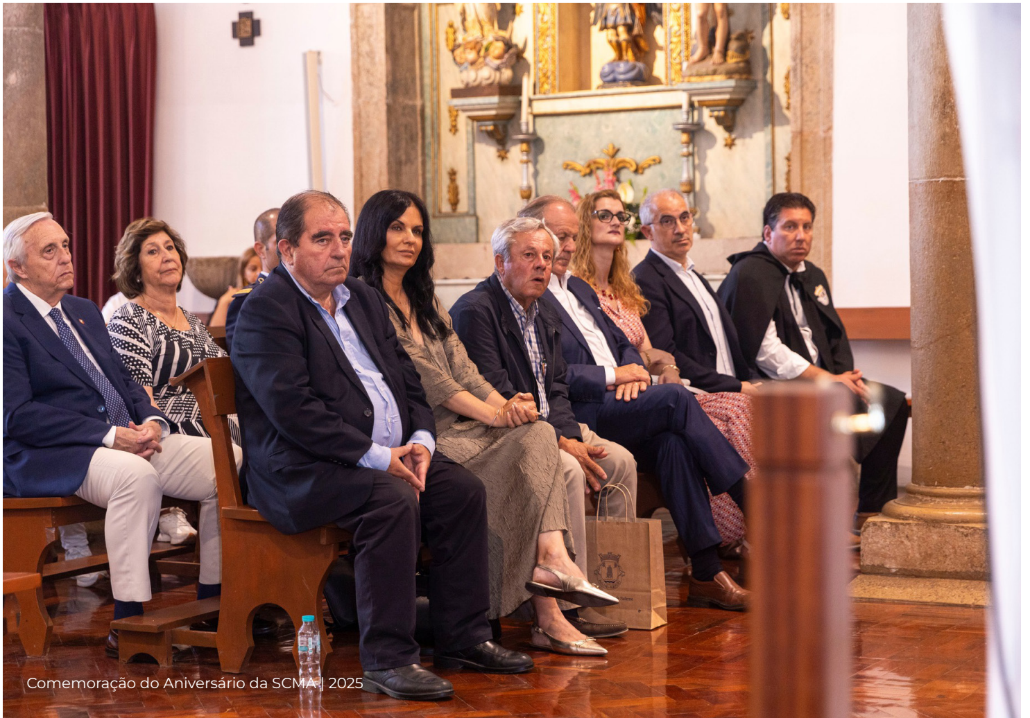
Comemoração do Aniversário da SCMA | 2025