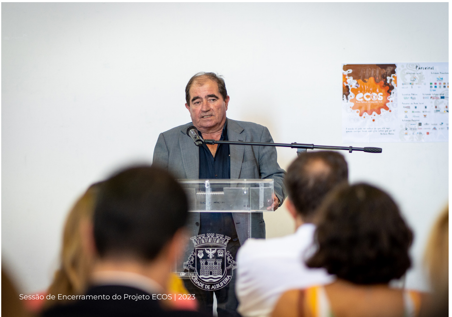
Sessão de Encerramento do Projeto ECOS | 2023