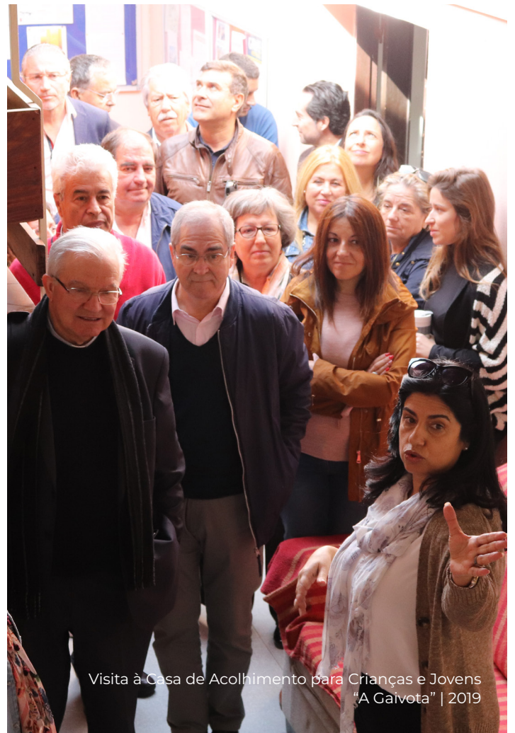
Visita à Casa de Acolhimento para Crianças e Jovens "A Gaivota" | 2019