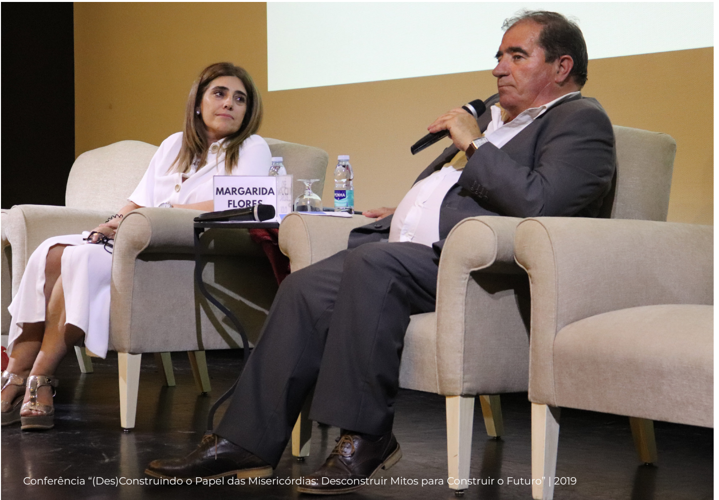
Conferência "(Des)Construindo o Papel das Misericórdias: Desconstruir Mítos para Construir o Futuro" | 2019