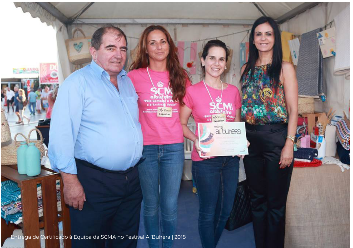
Entrega de Certificado à Equipa da SCMA no Festival Al'Buhera | 2018