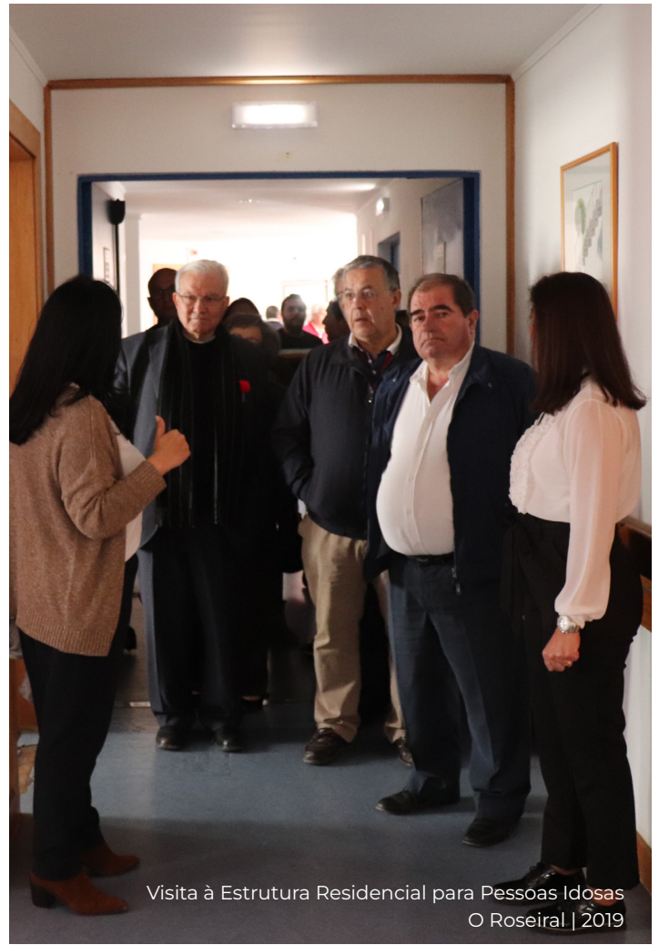
Visita à Estrutura Residencial para Pessoas Idosas O Roseiral | 2019