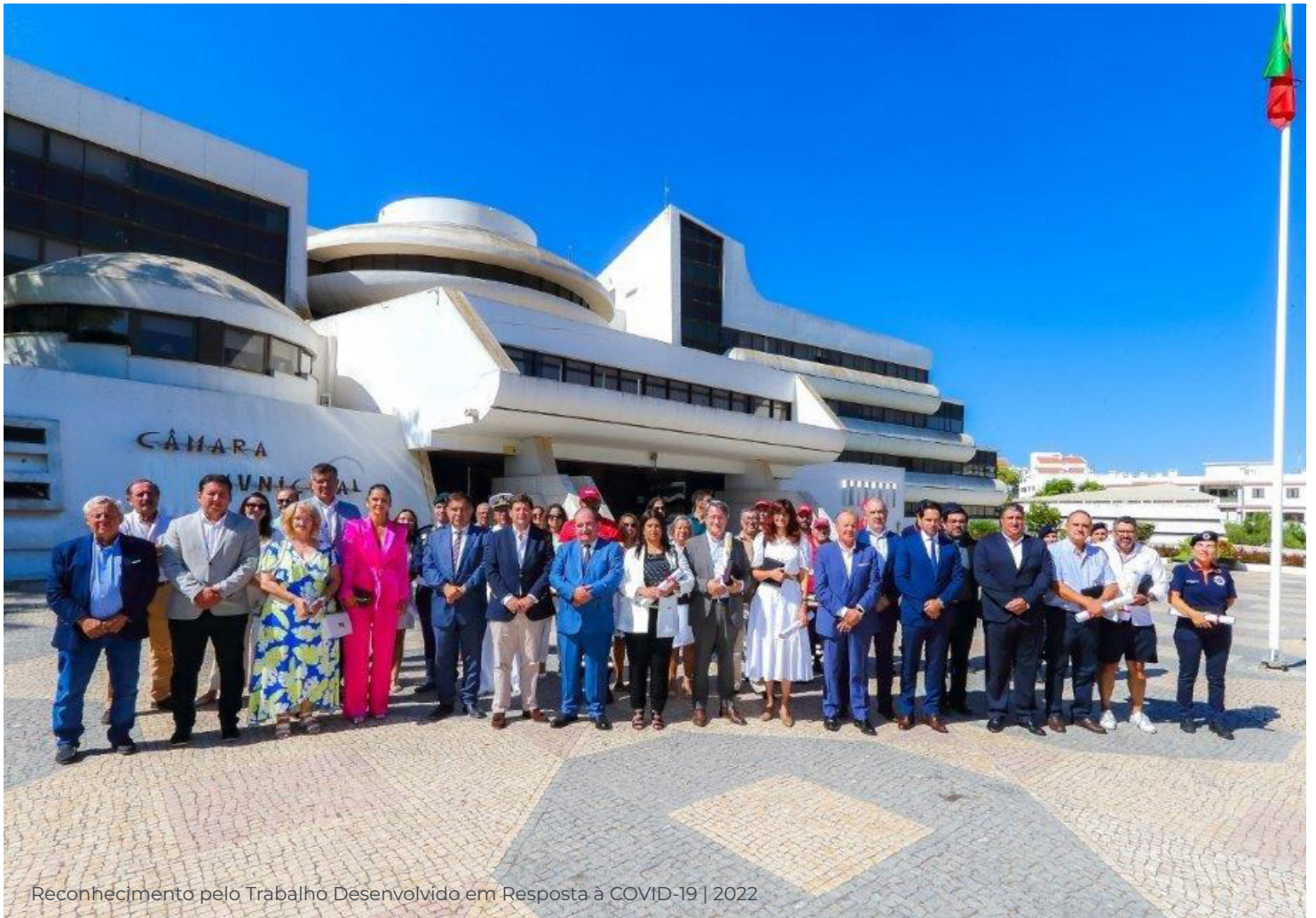
Reconhecimento pelo Trabalho Desenvolvido em Resposta à COVID-19 | 2022