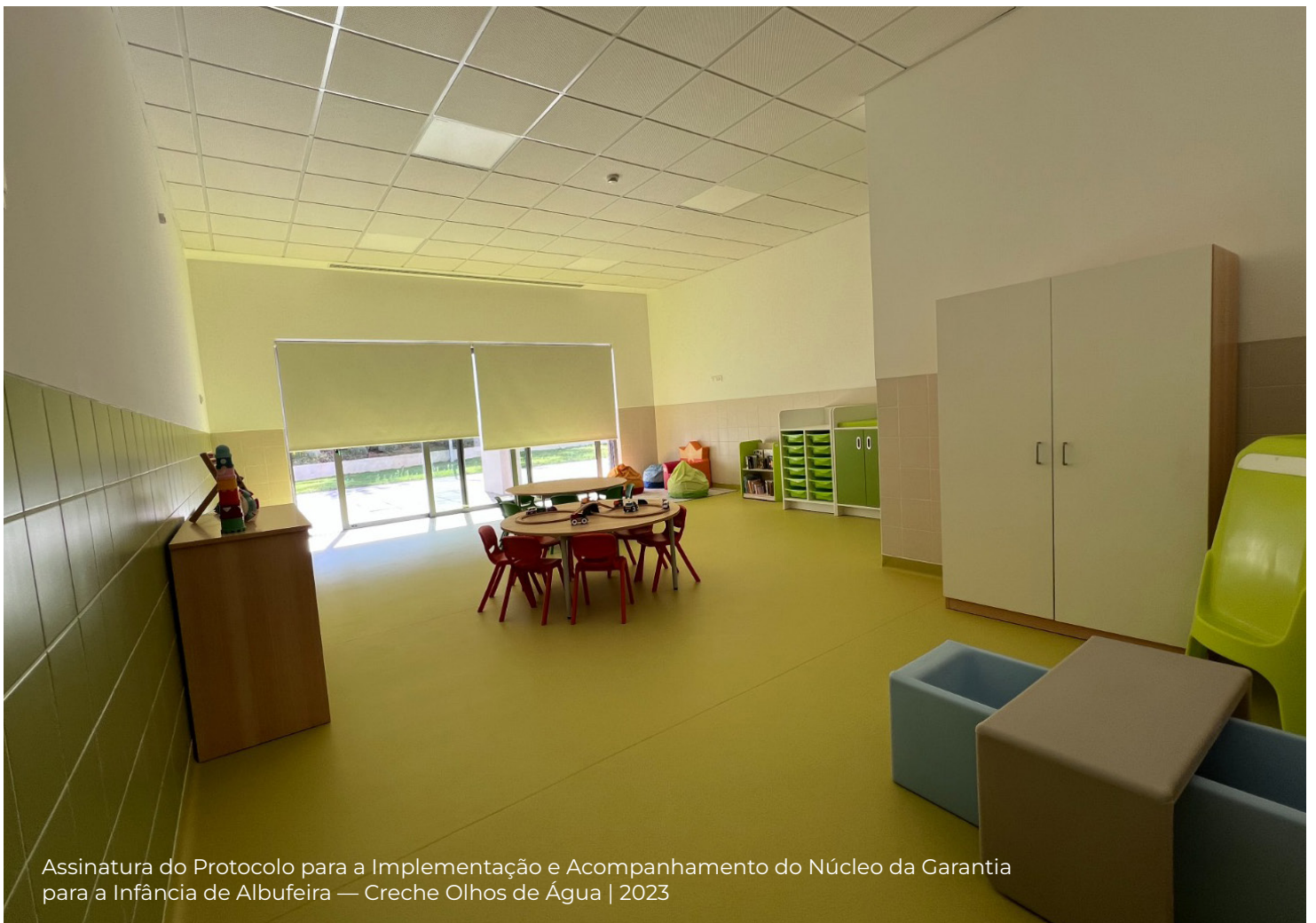
Assinatura do Protocolo para a Implementação e Acompanhamento do Núcleo da Garantia para a Infância de Albufeira — Creche Olhos de Água | 2023