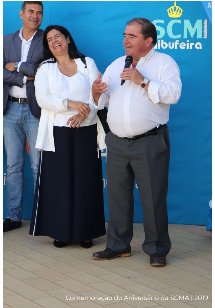
Comemoração do Aniversário da SCMA | 2019