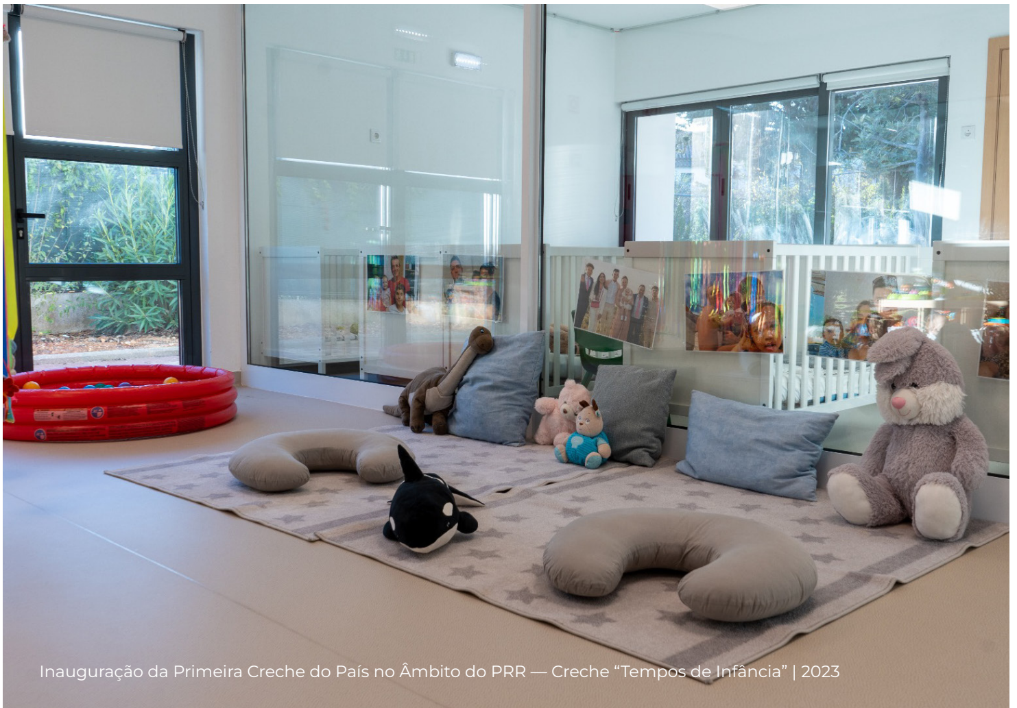
Inauguração da Primeira Creche do País no Âmbito do PRR — Creche “Tempos de Infância” | 2023