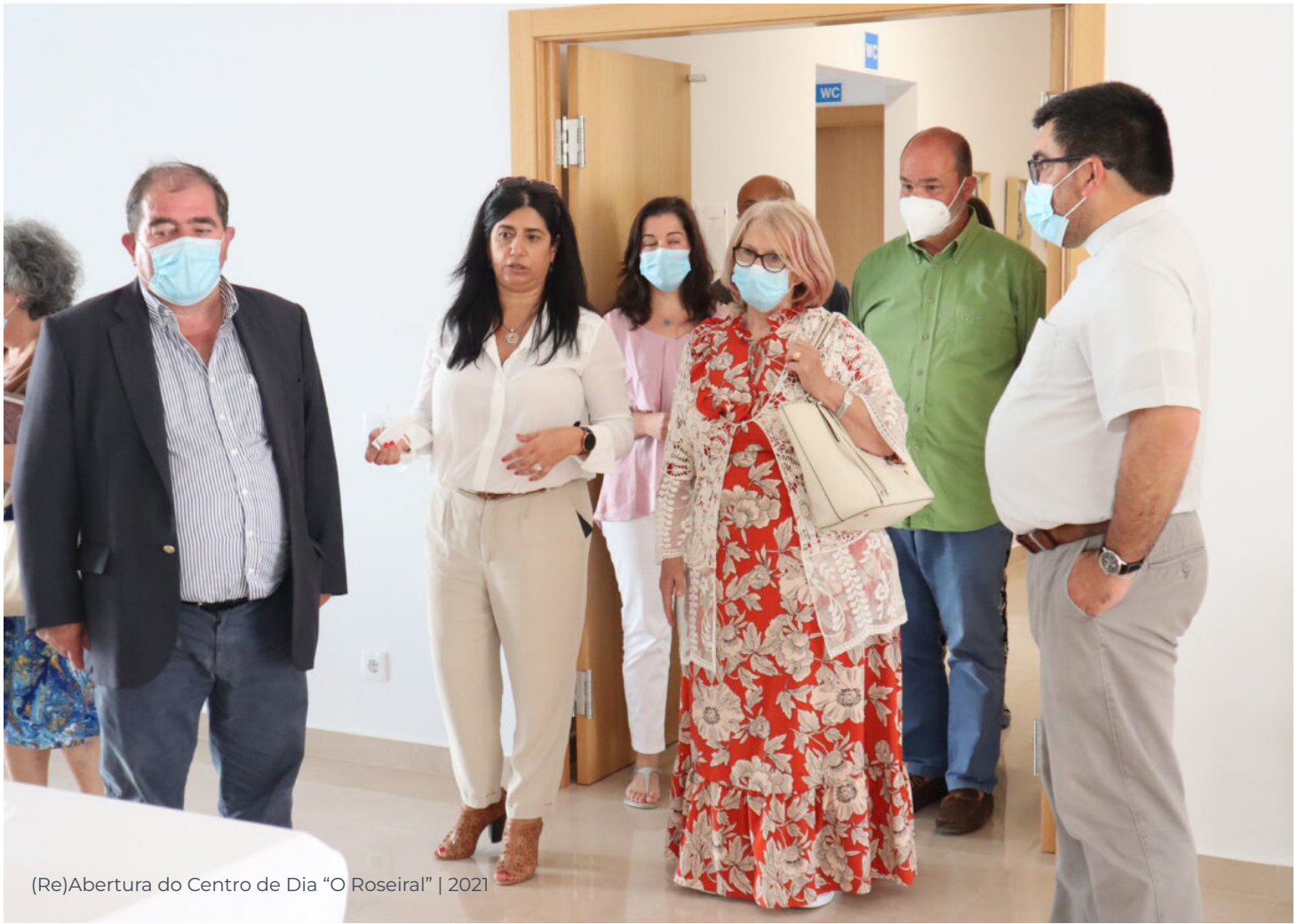
(Re)Abertura do Centro de Dia "O Roseiral" | 2021