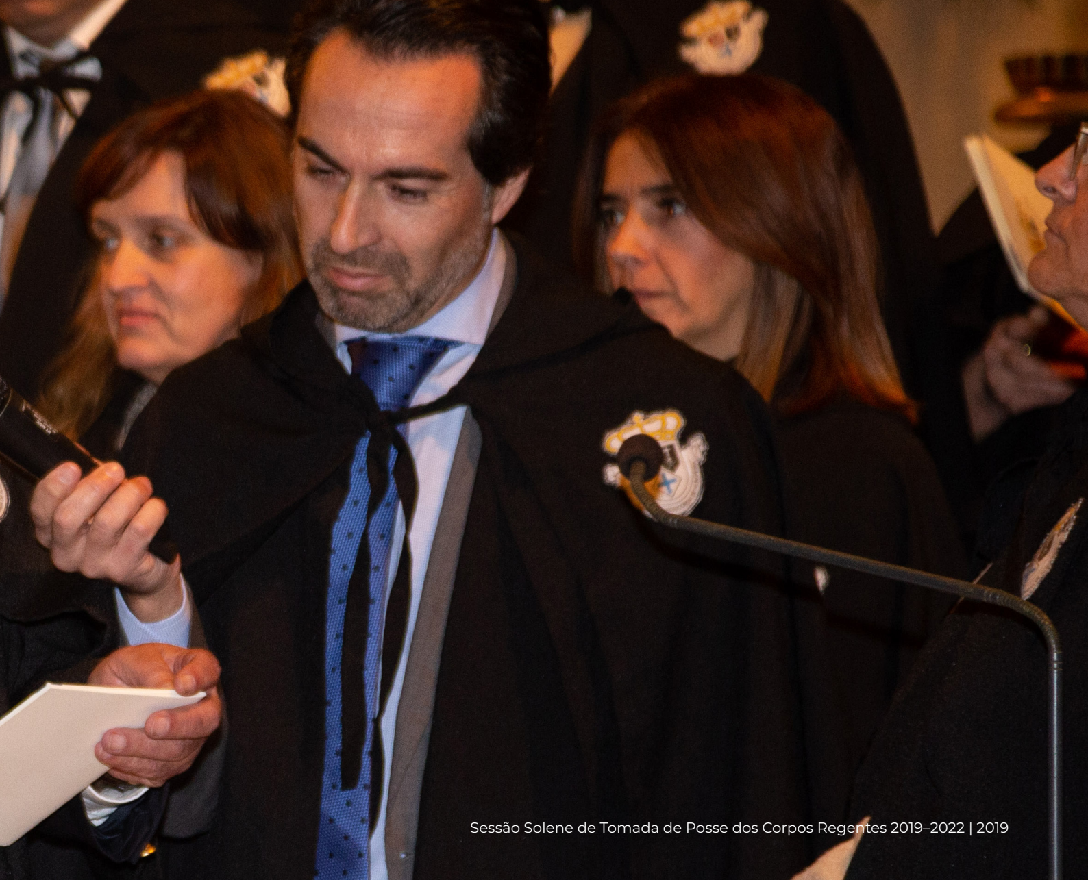
Sessão Solene de Tomada de Posse dos Corpos Regentes 2019–2022 | 2019

cando-se pelo seu sentido de serviço público, proximidade à comunidade e dedicação ao concelho de Albufeira.