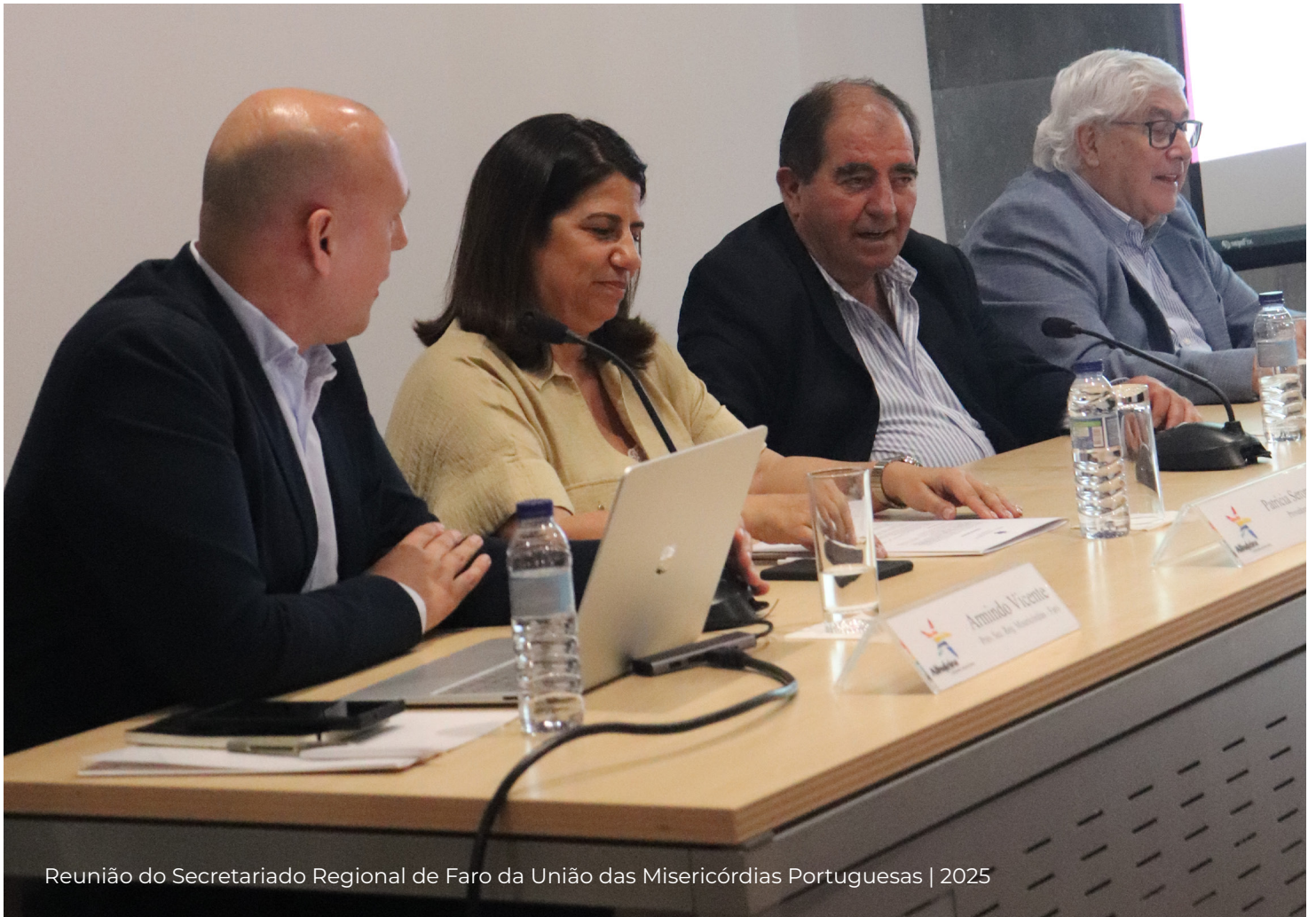
Reunião do Secretariado Regional de Faro da União das Misericórdias Portuguesas | 2025